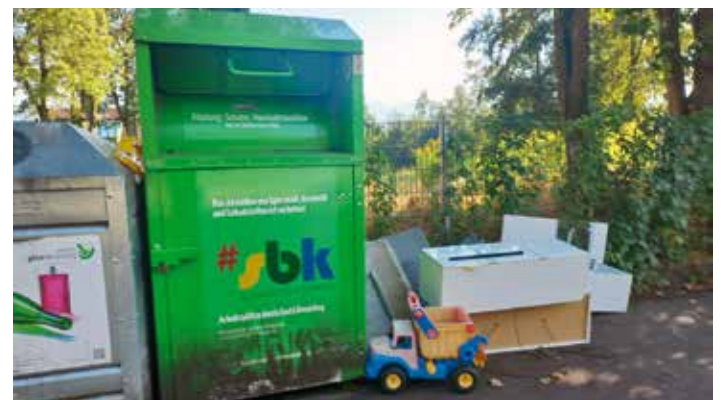
DEPONIEREN SIE KEINE ABFÄLLE BEI SAMMELSTELLEN VON GLAS UND TEXTILIEN

Leider laden offenbar die Sammelplätze für Altglas und Altkleider nach wie vor zum „Entsorgen“ von Sperrmüll ein, obwohl es in (fast) jeder Gemeinde ein Altstoffsammelzentrum gibt. Anscheinend will aber von so manchem Bürger/mancher Bürgerin für die sachgerechte Entsorgung von Sperrmüll nichts bezahlt werden und die Verursacher:innen lassen lieber die Allgemeinheit für die Entsorgung ihres Mülls zahlen – ein sehr unsoziales und unfaires Verhalten. Bitte bringen Sie alle ihre sperrigen Abfälle, wie alte Möbel zum Beispiel und alle ihre gefährlichen Abfälle (kostenlose Abgabe) wie Elektroaltgeräte und Batterien unbedingt in das Altstoffsammelzentrum (Recyclinghof) Ihrer Gemeinde und tragen Sie zu einer ordnungsgemäßen Entsorgung des Mülls bei.